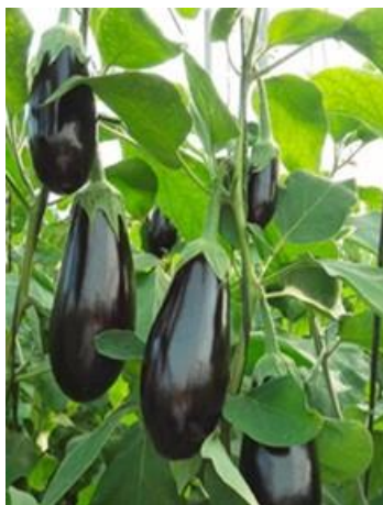
Evolución del precio medio de campaña (€/kg): berenjena negra