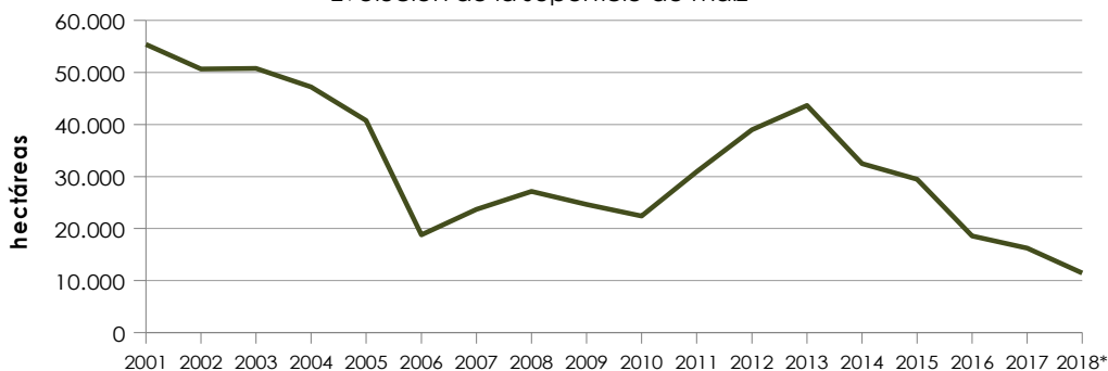
Evolución de la superficie de maíz

En 2017, el maíz, junto con el resto de cereales, aportaron en Andalucía el 4,07% del valor de la producción vegetal y el 3,4% de la Producción de la Rama Agraria.