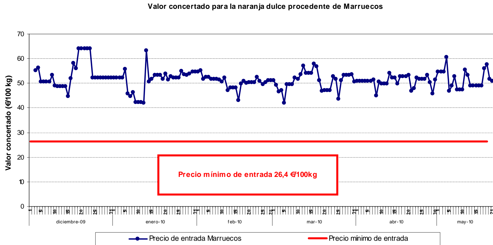
Gráfico 1 Evolución de las cotizaciones de naranja procedente de Marruecos a lo largo de la campaña 2009/10.