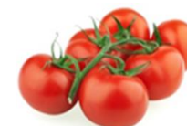
Distribución de los costes de producción de tomate rama (%)