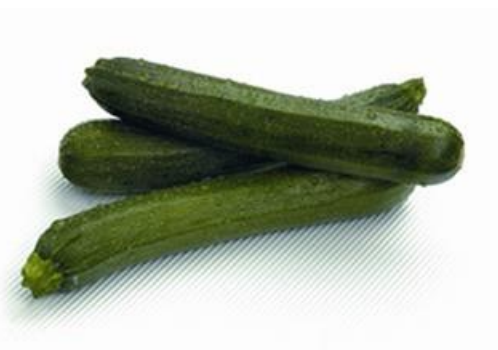
Evolución del precio medio de campaña (€/kg): calabacín verde