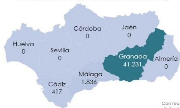
Distribución provincial de la producción (t)