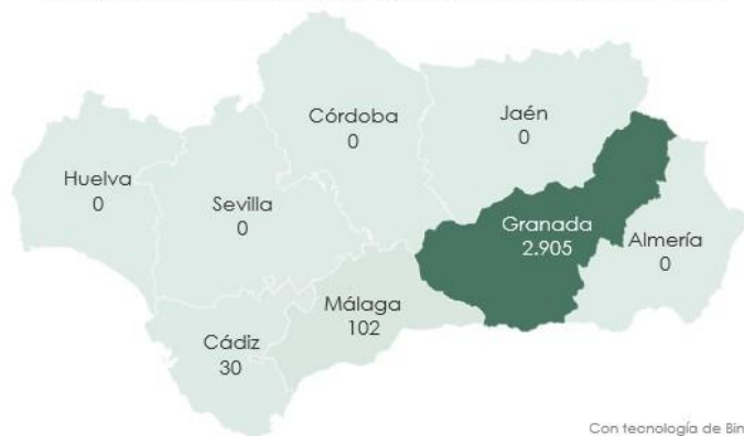
Distribución provincial de la superficie en producción (ha)