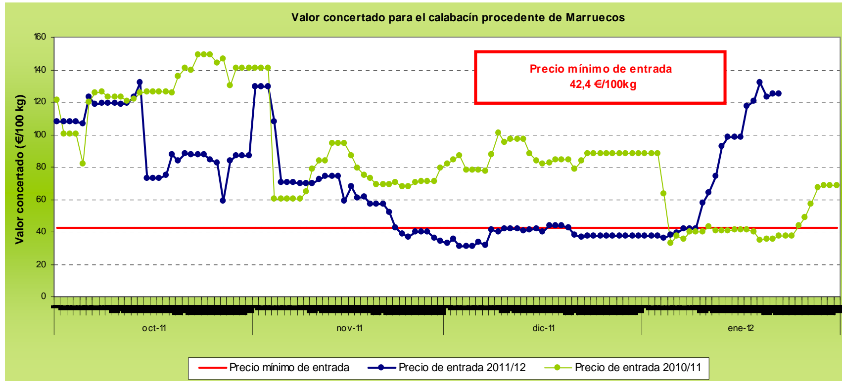
Gráfico 2 Evolución de las cotizaciones de calabacín procedente de Marruecos a lo largo de la campaña 2011/12.