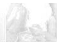
Hortícolas al aire libre