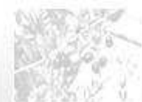
Aceite de oliva