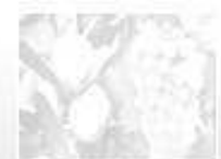
Aceituna verde Uva vinifica