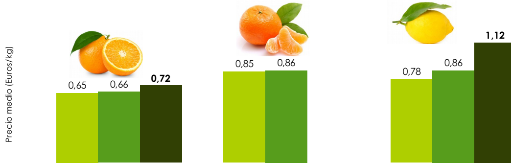
Gráfico 2 Evolución de los precios medios semanales a la salida de la central de manipulación de la naranja, mandarina y limón en las tres últimas semanas. (Euros/kg).