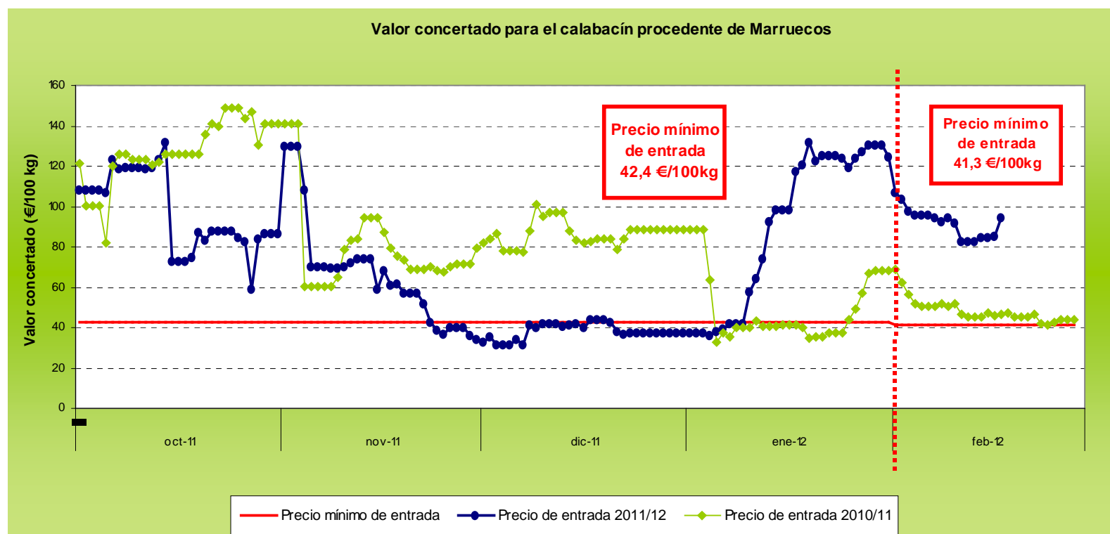
Gráfico 2 Evolución de las cotizaciones de calabacín procedente de Marruecos a lo largo de la campaña 2011/12.