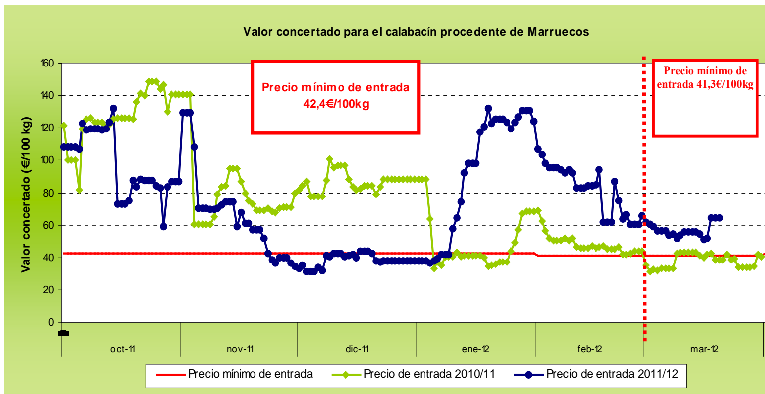
Gráfico 2 Evolución de las cotizaciones de calabacín procedente de Marruecos a lo largo de la campaña 2011/12.